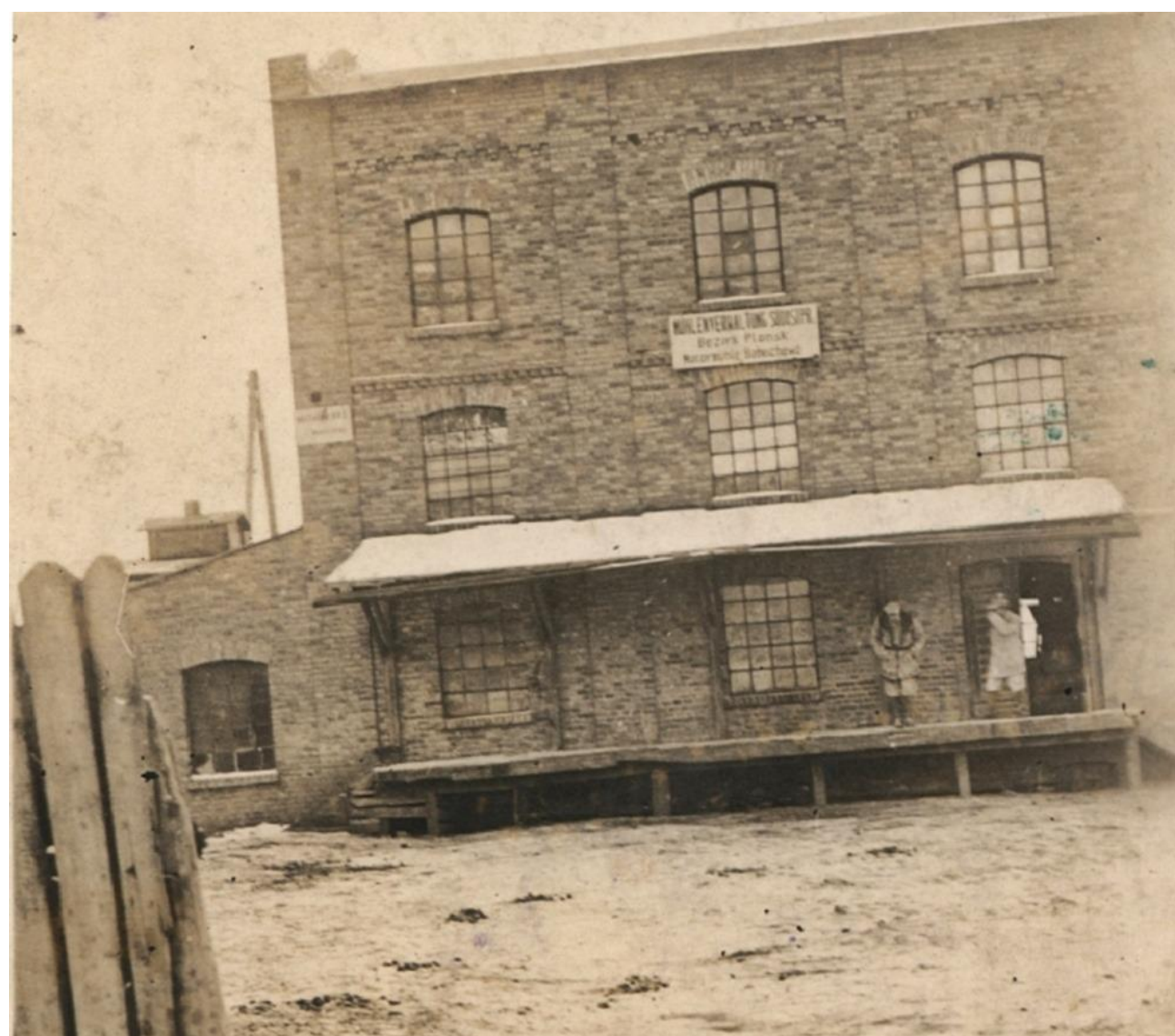
zdjęcie ok. 1944r.