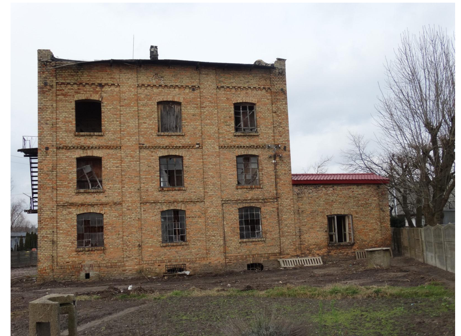
zdjęcie ok. 2020r.