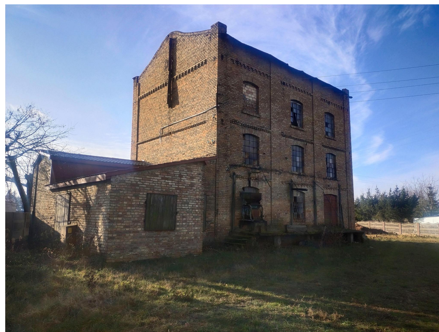
zdjęcie ok. 2020r.